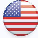
الولايات المتحدة الأمريكية