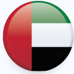
الإمارات العربية المتحدة