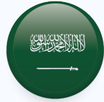
المملكة العربية السعودية